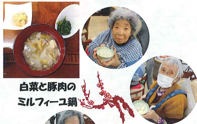
白菜と豚肉の ミルフィーユ鍋